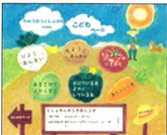
OPACキッズトップメニュー(イメージ)