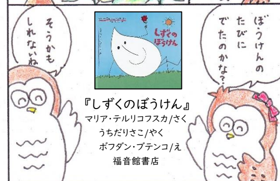
『しずくのぼうけん』 マリア・テルリコフスカ / さく うちだりきこ / やく ぽつだん・ブテンコ / え 福音館書店