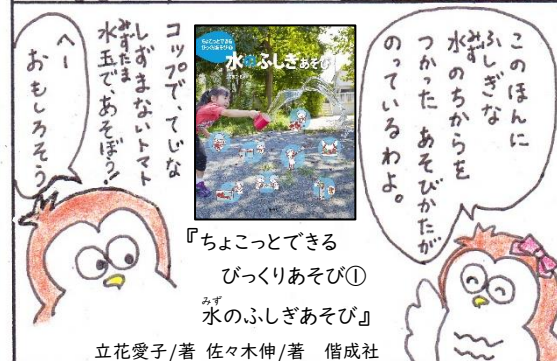
『ちょこつとできるびっくりあそび① 水のふしぎあそび』 みず 立花愛子 / 著 佐々木伸 / 著 偕成社