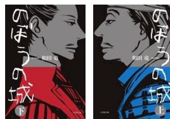
『のぼうの城(上・下)』和田竜／著 小学館 (小学館文庫)

参加者がテーマに沿ったお気に入りの本を持ちより、それぞれ5分で本の魅力を紹介。3分の質問タイムを経て全員が発表を終えたら、「読みたくなかった本」に投票し、チャンプ本を決定する。(今回の中学生大会は、テーマなし)